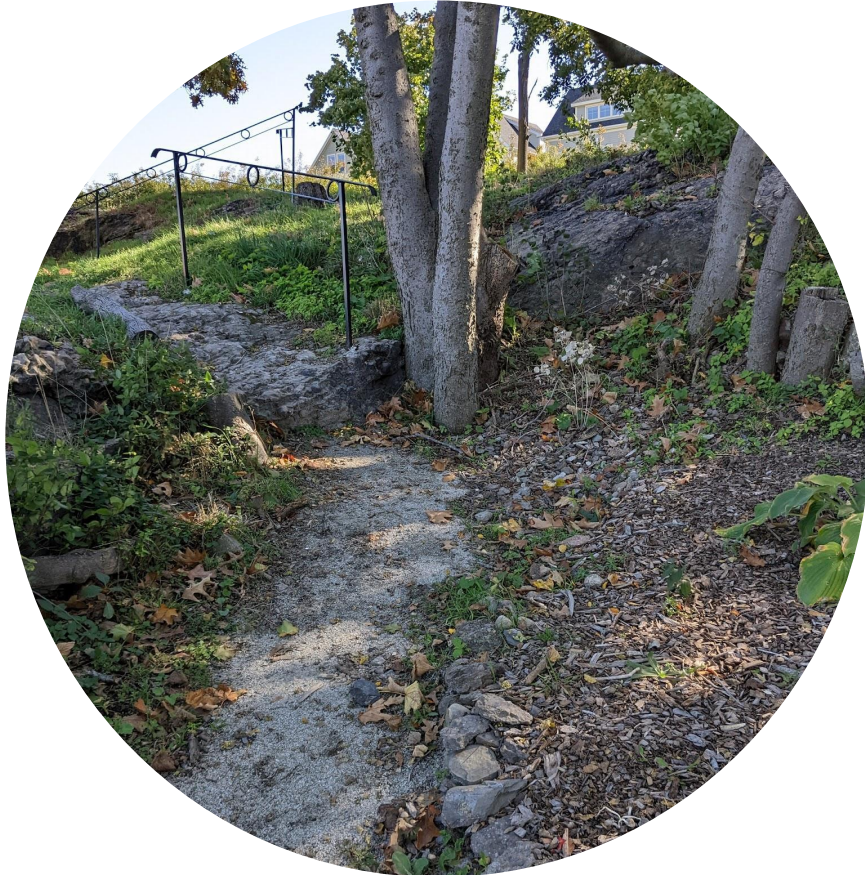
Jaden Savin Hill Wildlife, Dorchester