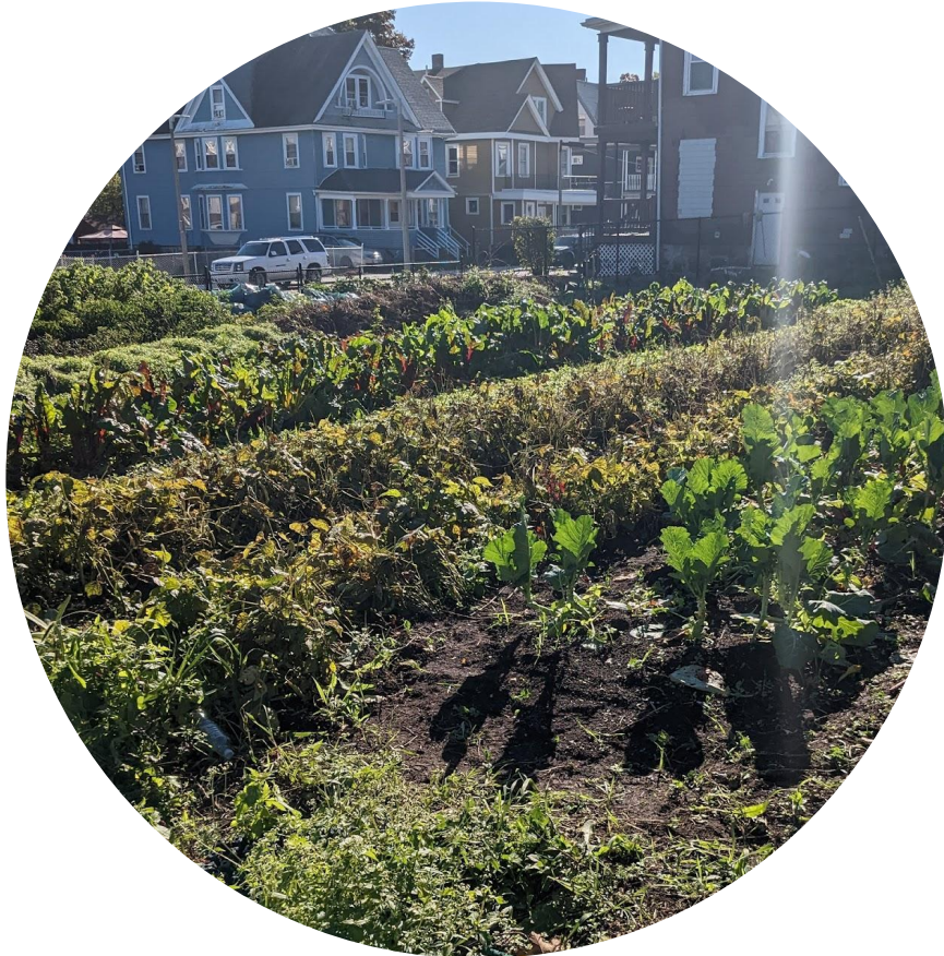
East Cottage Farm, Roxbury